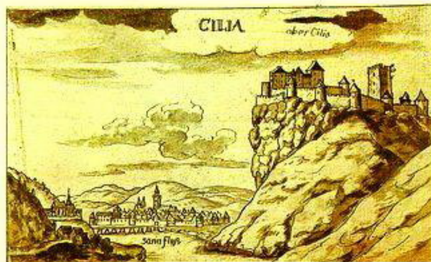
Georg Matthaus Vischer Celje z gradom, ok. 1685, lavirana perorisha